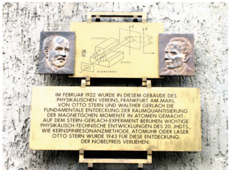
Abb. 6 Diese Gedenktafel der Frankfurter Universität würdigt die wissenschaft-

Stern hatte zwar mit Deutschland für immer gebrochen, aber nicht mit seinen Freunden und der deutschen Kultur. Aus den