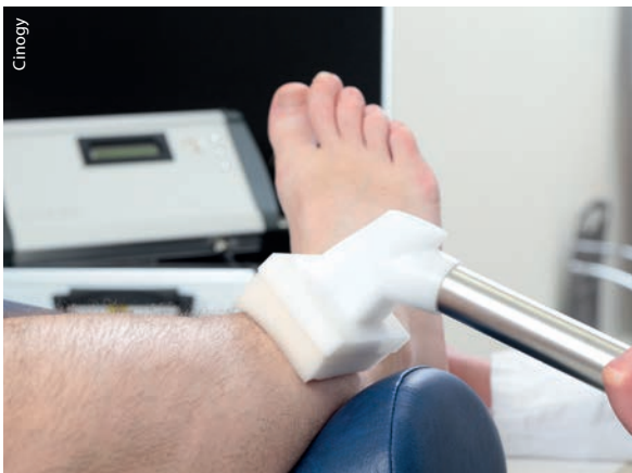
Abb. 1 Bei diesem Gerät, das die dielektrische Barriereentladung nutzt, dient die Haut als zweite Elektrode. Das Verfahren muss wechselnde Hautwiderstände und Luftfeuchtigkeit kompensieren, um zuverlässig zu arbeiten.

Bei der Wunde angekommen, wirkt das Plasma zweifach auf den Heilungsprozess ein: Erstens desinfiziert es – es tötet also Keime jeglicher Art ab. Zweitens stimuliert es auf Zellebene die Gewebeneubildung: Die Bestandteile des Plasmas verändern die Signale, mit denen die Zellen untereinander kommunizieren, und begünstigen so das Wachstum neuer Zellen.