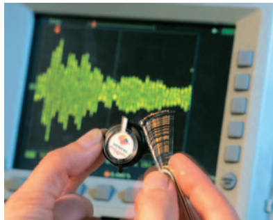
Dieser passive Sensor überträgt Schallwellen ganz ohne eigene Stromversorgung

Die Basisstation sendet dazu kontinuierlich Mikrowellen der Frequenz 2,5 Gigahertz aus, die von dem Sensor, einer Kombination aus einem Wandler und einer Antenne, aufgefangen werden. Die Messung