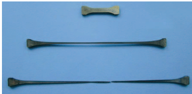
Dehnbar wie Gummi ist dieser superplastische Stahl

Leichtmetalle wie Aluminium und Magnesium und hochfeste Kunststoff-Komposite bereichern zunehmend die Werkstoffpalette der Autobauer. Denn ein Schlüssel zu geringerem Kraftstoffverbrauch liegt in immer leichteren Wagen. Doch mit modernen, stabilen und dabei leichten Legierungen bleibt auch Stahl konkurrenzfähig. Materialforscher des Max-Planck-Instituts für Eisenforschung in Düsseldorf haben nun extrem feste und besonders dehnungsfähige Leichtstähle entwickelt.