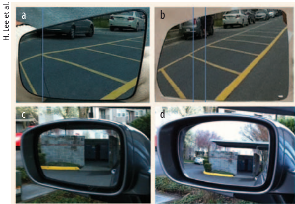
Der neu entwickelte Außenspiegel verzerrt weniger und hat ein großes Gesichtsfeld: (a) asphärischer Spiegel, (b) Gleitspiegel, (c) Planspiegel, (d) Gleitspiegel. Die blauen Linien markieren die Übergänge.

Der Außenspiegel eines Autos sollte ein möglichst großes Bildfeld haben und einen möglichst kleinen toten Winkel. Mit einem Planspiegel ist das nicht zu erreichen, trotzdem ist etwa in den USA für die Fahrerseite eines Autos